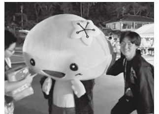
村葛尾村の盆踊り大会の実行委員として参加する著者