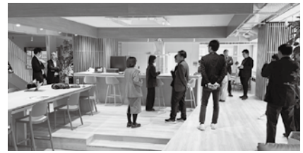
休憩時間中に意見交換する参加者

当初は金沢大学現地のみでの開催を計画しました。しかし、学会での告知から締め切りまで期間が短かったことや、三連休観光シーズンに重なった為か市内の宿泊施設料金が高騰するなどの課題があり、途中からオンラインでの発表と聴講を可能とするハイブリッド形式に変更しました。結果的にはこれが功を奏したようで、現地発表者21、遠隔発表者8、現地聴講者12、オンライン聴講者24という参加人数に結実しました。