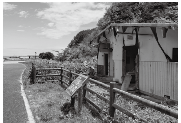
震災メモリアルパーク中の浜 (2025年6月27日 筆者撮影)

「震災遺構」として残った以上、人間の寿命を超えた時間を生きていく。それは、過去、現在、未来という時間を架橋し、被災の経験も、社会的、時間的な違いをもつ自他の間に新たな意味を育む可能性を秘めている。しかし意味が宿らなければ、語られる「震災遺構」にはなり得ない。ただあるだけでは意味がない。語られ、意味が生まれ、公共の空間となり得るのか、今岐路にたっている。