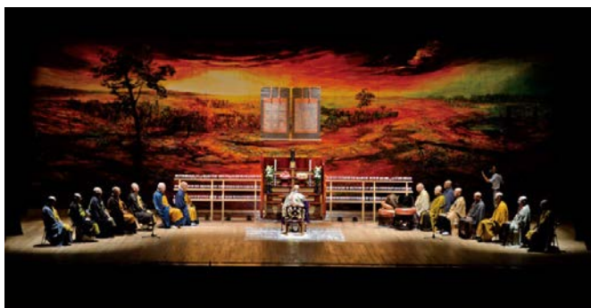
(図2) 気仙沼仏教会による七回忌慰霊・復興祈願法要

本イベントにおけるそうした演出は、いわゆる「アート」に分類されるものだけではない。例えば2017年のコンポジウム気仙沼では、被災者を追悼する「七回忌慰霊・復興祈願法要」が行われた。これは気仙沼の仏教者によって設立された「気仙沼仏教会」の初事業でもあった。