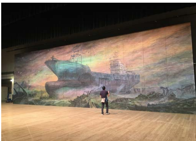
(図4) 巨大画 《共徳丸と海》

この点について、とりわけ第一筆者が関心を持ったのは、本イベントの舞台背景を飾る、横幅 16.5m・縦幅 5.4m にもおよぶ震災時の情景が描かれた巨大な絵画である。視界すべてを覆う絵の巨大さは、絵の中の世界と現実世界の境界を曖昧にさせ、「災害時」と「平常時」という二つの時間を媒介する。