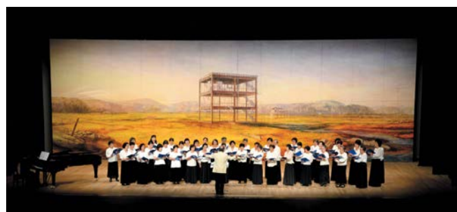
（図1）気仙沼アマチュアコーラス連絡会による合唱

本イベントは、気仙沼市民を中心とする実行委員会のもとで、2015年に「レクイエムプロジェクト気仙沼」として開催された。そして2016年には「コンポジウム気仙沼」に名称を変更し、2018年までに計4回開催されており、毎回数百人の一般来場者や出演者が参加している。イベントの内容は多岐にわたるものであり、追悼法要や未来の気仙沼を語り合うトーク、伝統芸能、音楽やダンスによる演出など、様々な演目が実施された。