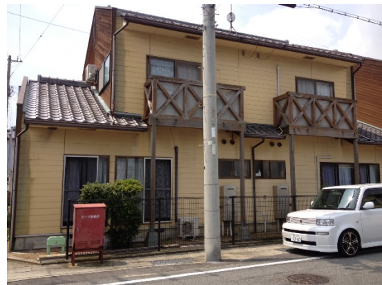
旧東浦町 仮屋地区